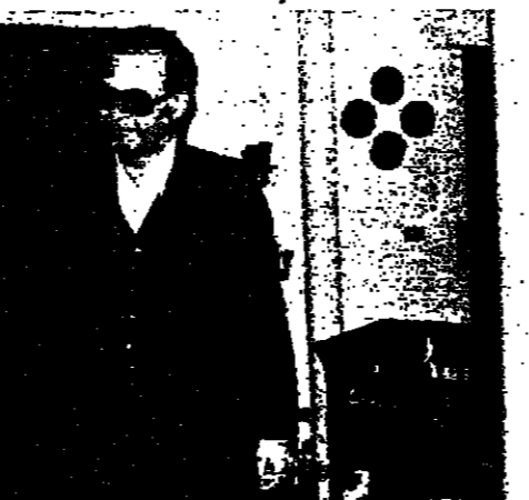
الرئيس الحص يستقبل المفيد هشام تريم

وقد جرى في الاجتماع عرض برنامج المشاريع التي أعدت تصاميمها لإعادة تعمير وسط بيروت، كما عرض الوزير البزري المشاريع التي سيمولها البنك العربي والتي تشمل تشييد مبنى مجلس الإنماء والإعمار، وتعمير وسط بيروت، وفتح الخطوط التجارية التي سيمولها البنك العربي، وأسس لخدمات الإسكان، ومؤسسات القطاع الخاص.